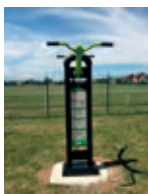
BARRE À TRACTIONS