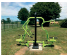
COMBINÉ PUSH-PULL MULTIPRISES