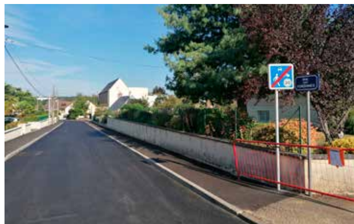
Renforcement de la chaussée Rue des Fontaines