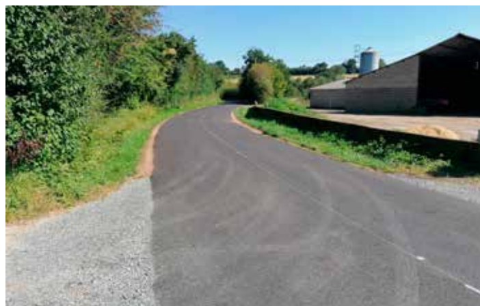
Réfection de la chaussée Route des Ardriers