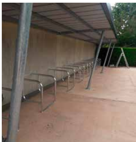
Abri à vélo à l'école primaire