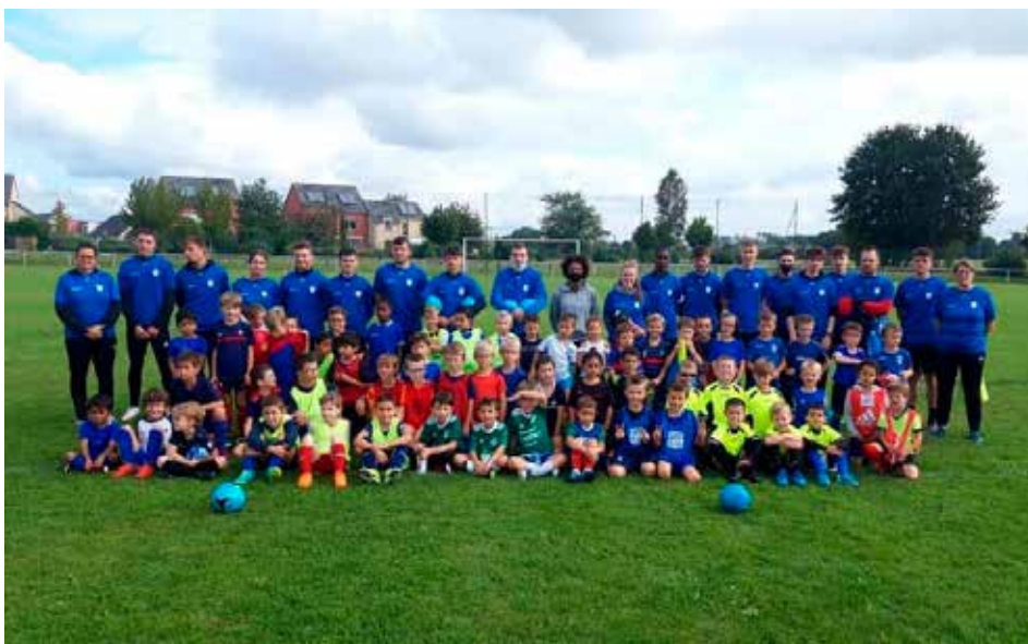
Les U7 avec leur staff