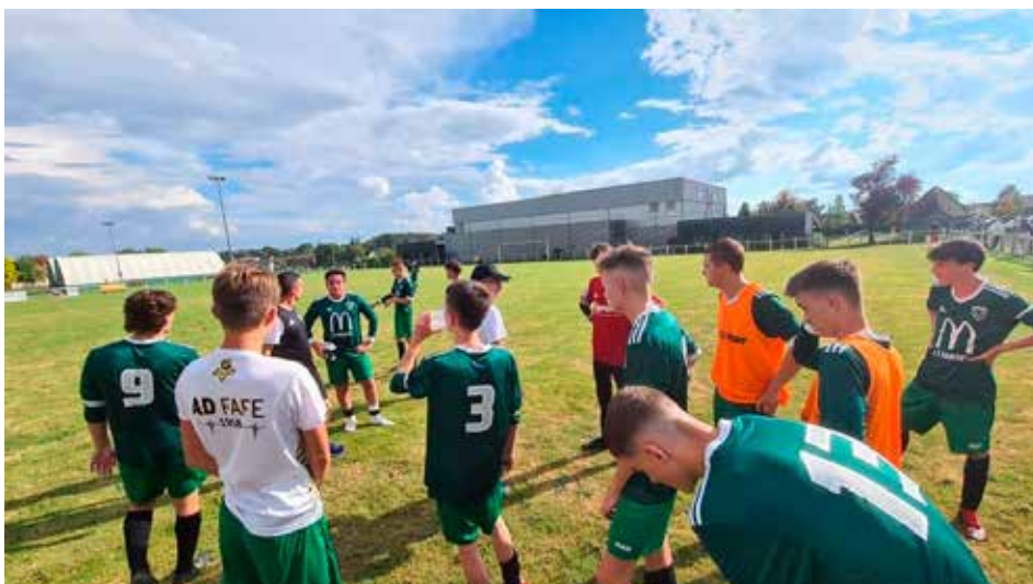
Les U18 à l'entraînement

Enfin nous compterons encore cette saison sur une équipe loisir de foot à 7 qui jouera ses matchs à domicile, le jeudi soir, au stade municipal.