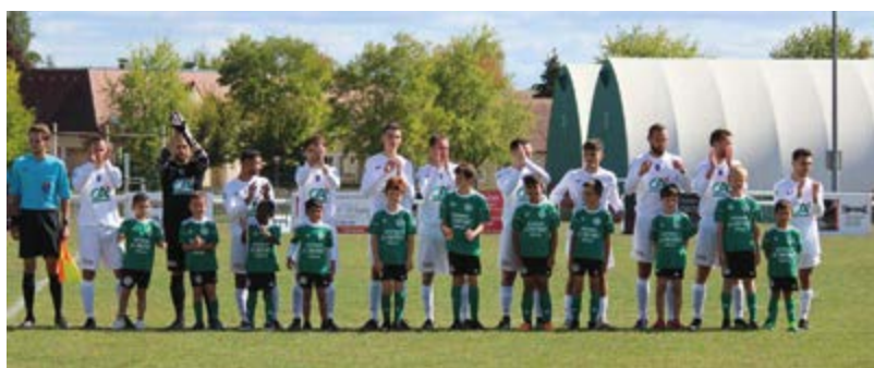
Coupe de France